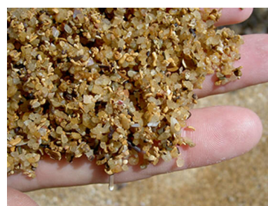
Mrtva korala iz Okinawe