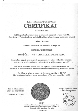
Certifikat BION: 2007

S preprostimi, pa vendar učinkovitimi dodatki ( H2O ACTIVATOR in BIOŠČIT NALEPKA ) lahko okrepi delovanje BIOŠČITA . Na ta način energetsko osvežimo in zaščitimo večje površine: sobo, stanovanje, hišo.